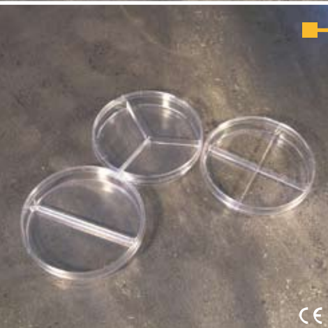
Piastre di Petri Ø 90 mm a SETTORI. Con ventilazione. In polistirolo con alta trasparenza ottica.