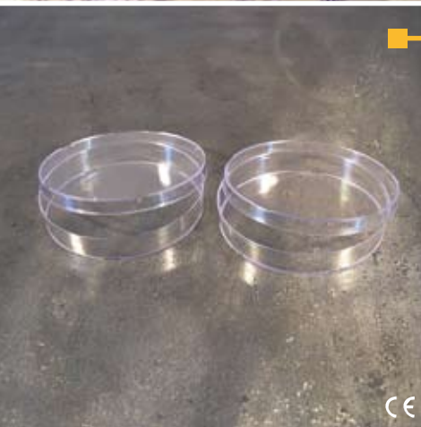
Piastre di Petri Ø 90 mm. In polistirolo con alta trasparenza ottica.

A wide range of Petri dishes, with high quality standard assured by a fully automated production process, under controlled aseptic conditions. Ideal for routine use, as well as for bacteria screening and for their use with automatic filling machines.